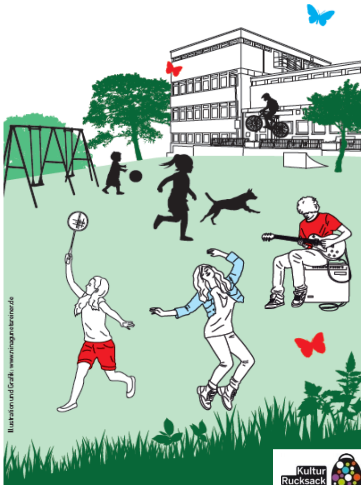
Illustration und Grafik: www.mimaginskreiner.de