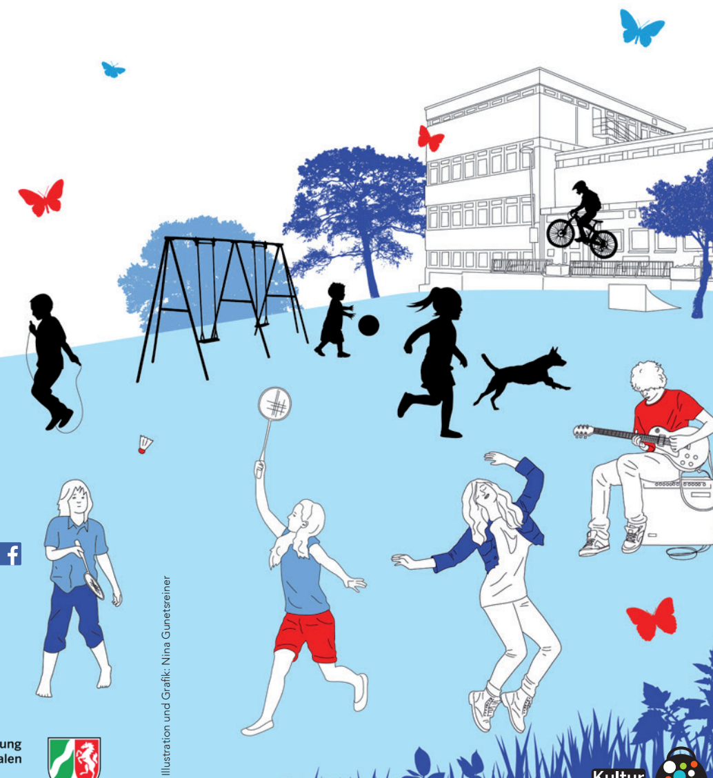
Illustration und Grafik: Nina Gunetsreiner